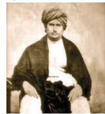
சுவாமி தயானந்த சரஸ்வதி

பஞ்சாபில், ஆரியசமாஜம் சீர்திருத்த இயக்கங்களுக்குத் தலைமையேற்றது. இது 1875இல் நிறுவப்பட்டது, இவ்வமைப்பை நிறுவியவர் மேலைகங்கைச் சமவெளியில் அலைந்துதிரிந்து கொண்டிருந்த சுவாமி தயானந்த சரஸ்வதி