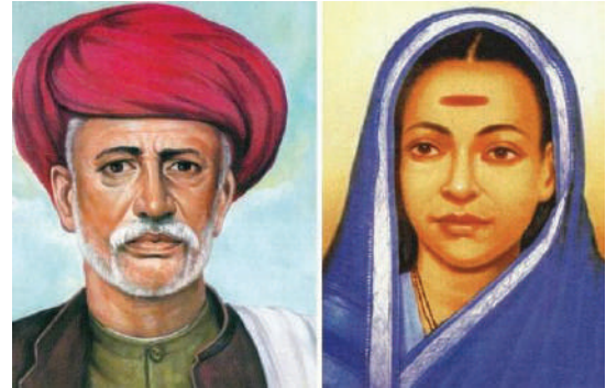
ஜோதிபா பூலே மற்றும் சாவித்திரி பாய்

ஜோதிபா கோவிந்தராவ் பூலே 1827இல் மகாராஷ்டிராவில் பிறந்தார். அவர் 1852ஆம் ஆண்டு ஒருக்கப்பட்டோருக்கான முதல் பள்ளியை புனேயில் திறந்தார். சத்தியசோதக் சமாஜ் (உண்மையை நாடுவோர் சங்கம், Truth Seekers Society) எனும் அமைப்பை, பிராமணரல்லாத மக்களும் சுயமரியாதையோடும், குறிக்கோளோடும் வாழத் தூண்டுவதற்காய் நிறுவினார். பூலே குழந்தைத் திருமணத்தை எதிர்த்தார். விதவை மறுமணத்தை ஆதரித்தார். ஜோதிபாவும் அவருடைய மனைவி சாவித்திரியும் ஒருக்கப்பட்ட மக்களின், பெண்களின் முன்னேற்றத்திற்காகத் தங்கள் வாழ்க்கையை அர்ப்பணித்தனர். ஜோதிபா பெற்றோரில்லா குழந்தைகளுக்கென்று விடுதிகளையும் விதவைகளுக்கென காப்பகங்களையும் உருவாக்கினார். அவர் எழுதிய நூலான 'குலாம்கிரி' (அடிமைத்தனம்) அவருடையப் பெரும்பாலான தீவிரக்கருத்துக்களைச் சுருக்கிக் கூறுகிறது.