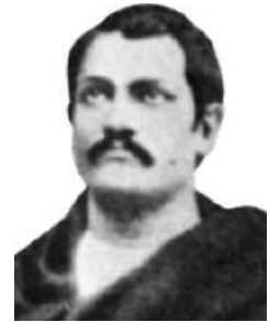
கேசவ் சந்திர சென்

தேவேந்திரநாத் மிதவாதச் சீர்திருத்தவாதியாவார். ஆனால் சமாஜத்தில் அவருடன் பணியாற்றிய இளையவர்கள் விரைவான மாற்றங்களையே விரும்பினர். அவர்களுள் மிக முக்கியமானவரான கேசவ் சந்திரசென்(1838-84), 1857இல் சபையில் இணைந்தார். 1866இல் பிரம்மசமாஜத்தின் உறுப்பினர்களிடையே பிளவு ஏற்பட்டதால் கேசவ் சந்திர சென் சமாஜத்திலிருந்து விலகி புதிய அமைப்பான கேசவ் சந்திர சென்