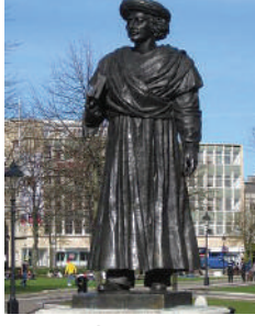
இராஜா ராம்மோகன் ராய்

புலமை பெற்றிருந்ததோடு சமஸ்கிருதம், அராபி, பாரசீகம், ஆங்கிலம் ஆகிய மொழிகளிலும் புலமை பெற்றிருந்தார். இராஜா ராம்மோகன் ராய் பொருளற்ற சமயச் சடங்குகளையும், கேடுகளை விளைவிக்கும் சமூக மரபுகளையும் எதிர்த்தார். இருந்த போதிலும் கடந்த காலத்துடனான தொடர்பை அவர் பாதுகாக்க விரும்பினார்.