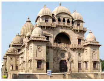
இராமகிருஷ்ணா மிஷன் பேலூர் மடம்

'சிவன்' எனவும் அவர் கூறினார் (வாழ்கின்ற அனைத்து உயிர்களும் இறைவனே). மனிதர்களுக்குச் செய்யப்படும் சேவையே கடவுளுக்குச் செய்யப்படும் சேவையாகும் என்றார்.