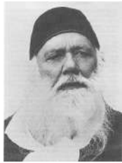
சர் சையத் அகமத்கான்

டெல்லியில் உயர்குடி முஸ்லீம் குடும்பத்தில் பிறந்த சையத் அகமத்கான் படிப்பறிவின்மையே குறிப்பாக, நவீன கல்வியறிவின்மையே இஸ்லாமியர்களுக்குப் பெருந்தீங்கு விளைவித்து, அவர்களைக் கீழ்நிலையில் வைத்துவிட்டது எனக்கருதினார். மேலைநாட்டு அறிவியலையும், அரசப்பணிகளையும் ஏற்றுக்கொள்ளும்படி அவர் இஸ்லாமியர்களை வற்புறுத்தினார். அறிவியல்கழகமொன்றை நிறுவிய அவர் ஆங்கிலநூல்களைக் குறிப்பாக அறிவியல் நூல்களை உருதுமொழியில் மொழியாக்கம் செய்தார்.