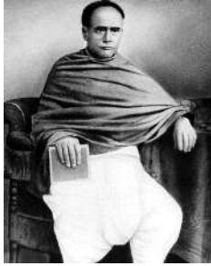
ஈஸ்வர் சந்திர வித்யாசாகர்

வங்காளத்தைச் சேர்ந்த மற்றொரு முதன்மையான சீர்திருத்தவாதி ஈஸ்வர் சந்திர வித்யாசாகர் (1820-1891) ஆவார். இராஜா ராம்மோகன் ராயும் மற்றவர்களும் சமூகத்தைத் திருத்துவதற்கு மேலைநாட்டுப் பகுத்தறிவுச் சிந்தனைகளின் துணையை நாடியபோது வித்யாசாகர் இந்து மறை நூல்களே